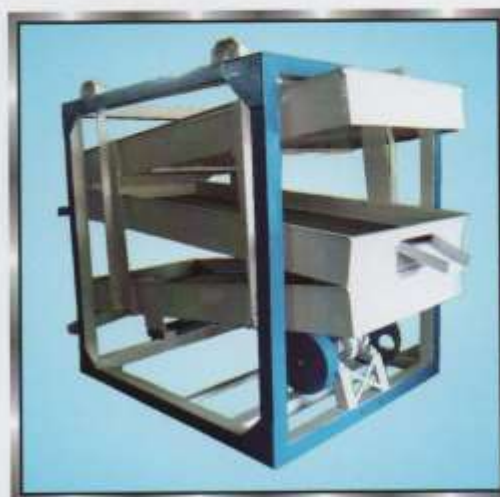
Chalna 3 Tray