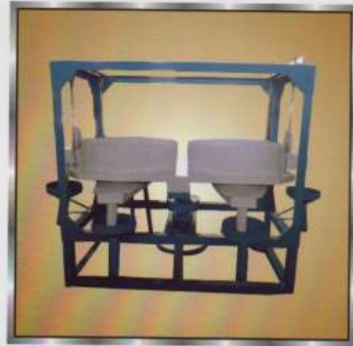
Double Round Lakh Chalna