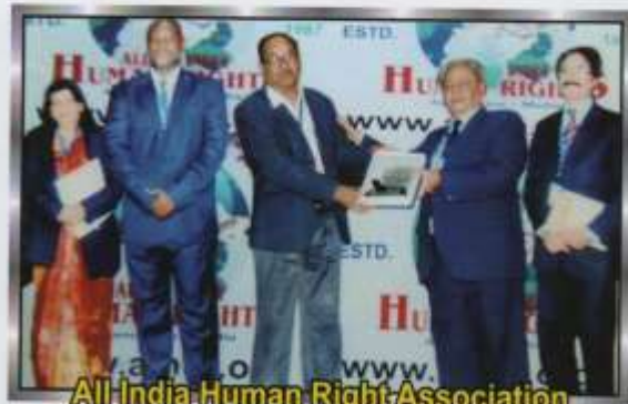
All India Human Right Association