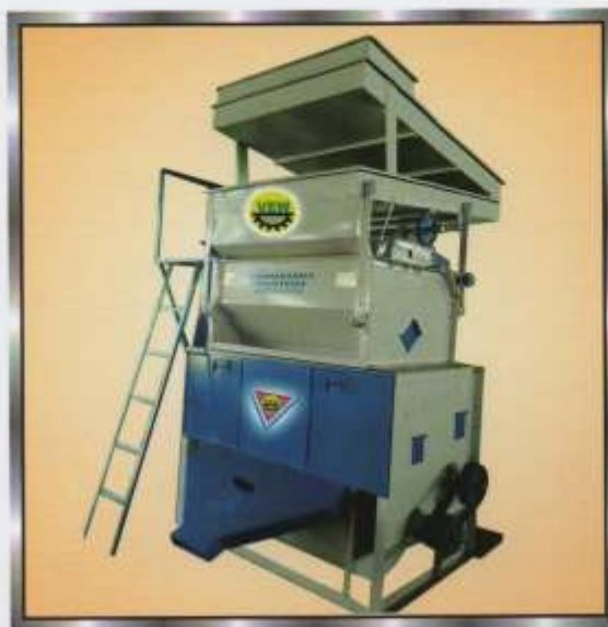
STONE CLEANER PADDY CLEANING PLANT