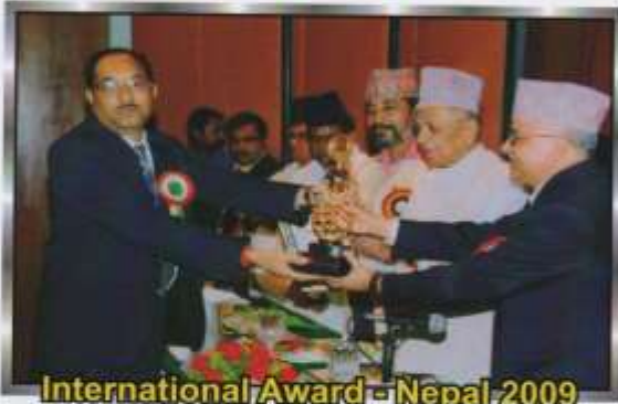
International Award - Nepal 2009

Hon'ble Shri Dr. Manmohan Singh (Prime Minister of India)