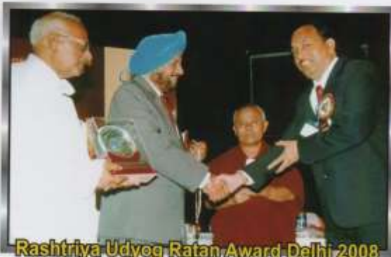
Rashtriya Udyog Ratan Award Delhi 2008