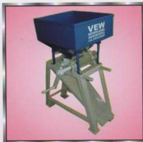
Lakh Crasher Machine