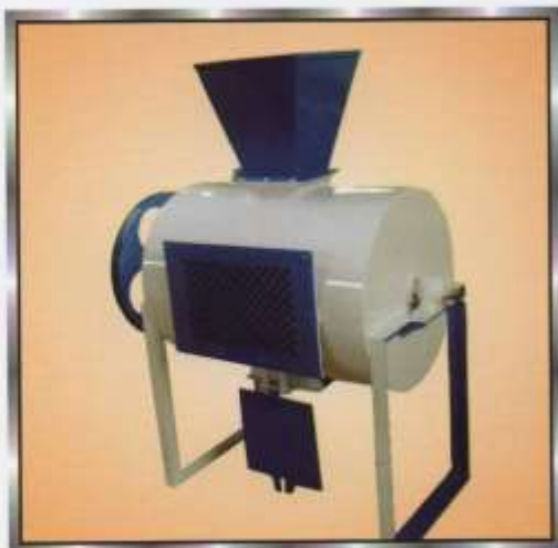
Lakh (Dhol) Washer Machine