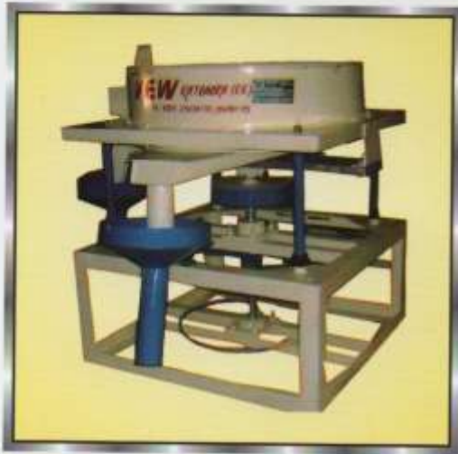
Single Round Lakh Chalna