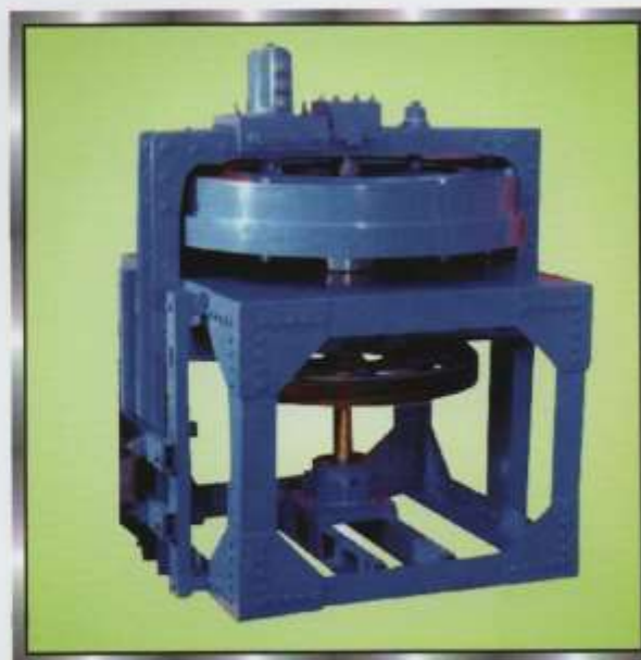
POHA PRESS MACHINE