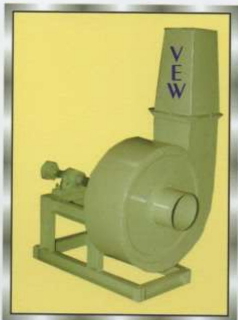
DUST COLLECTOR & REMOVER