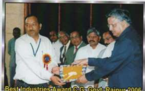
Best Industries Award C.G. Govt. Raipur 2006