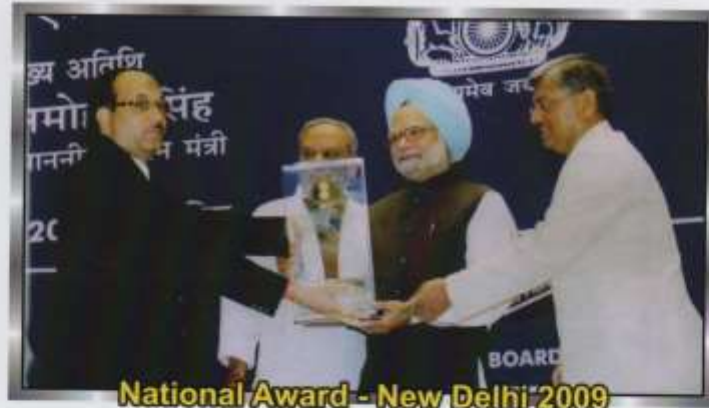
National Award - New Delhi 2009

Hon'ble Shri Dr. Manmohan Singh (Prime Minister of India)