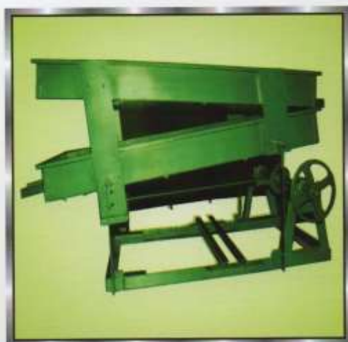
Chalna 2 Tray